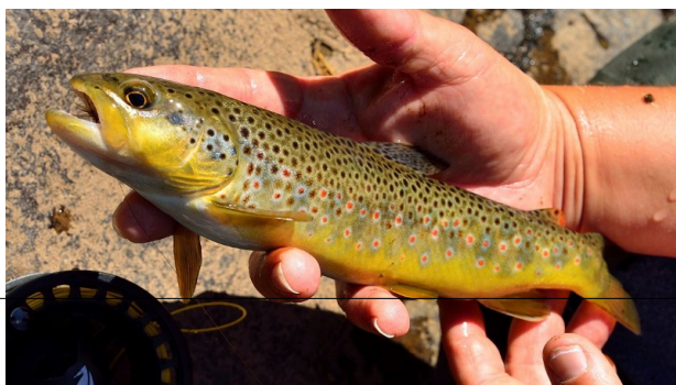
Truite de l'Espezonnette prise par Vincent

Nous vous souhaitons une bonne saison de pêche 2024 sur nos rivières encore préservées !